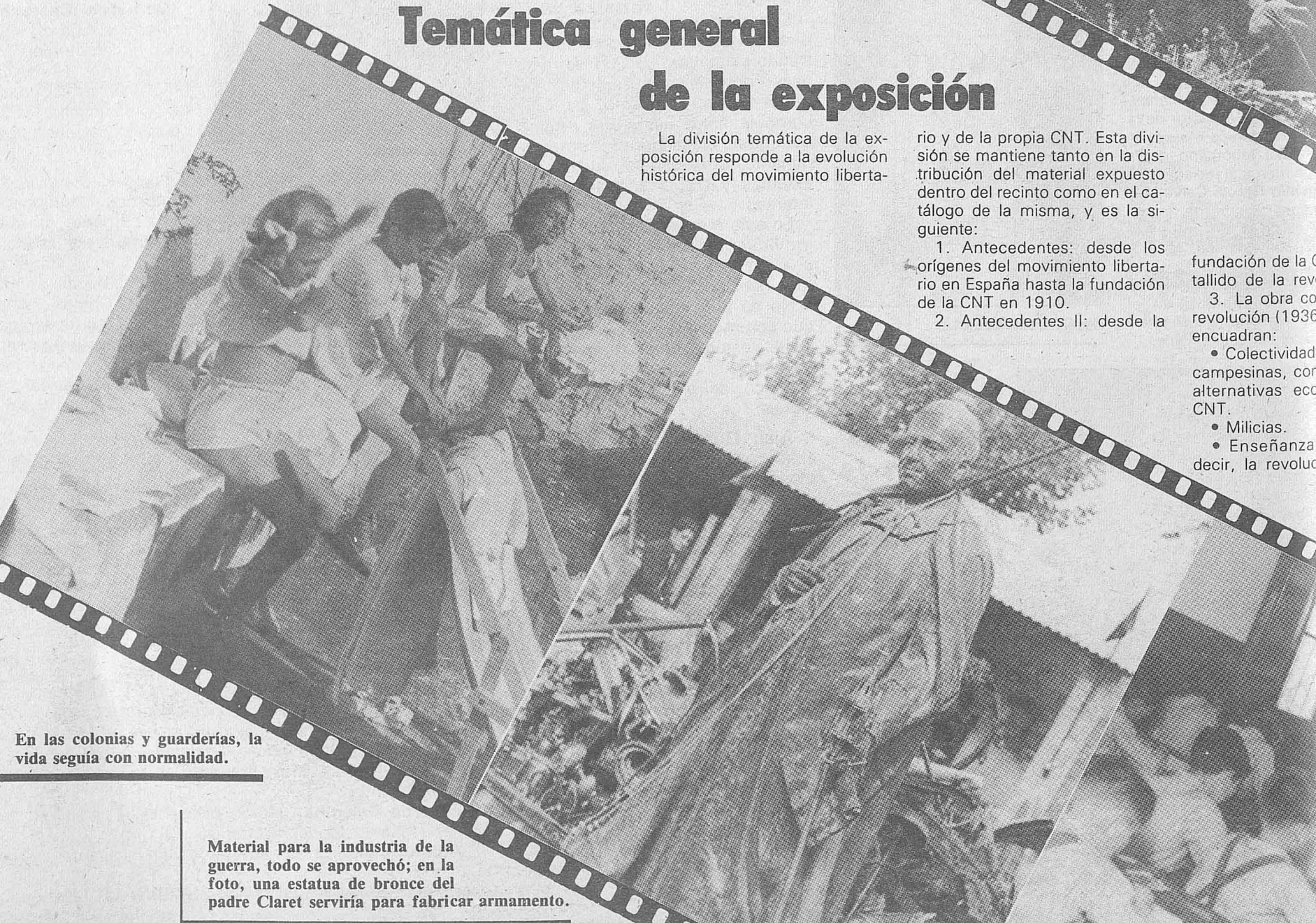
En las colonias y guarderías, la vida seguía con normalidad.

realizaciones alternativas y distintas llevadas a cabo por la CNT, proyectando estas alternativas hacia el momento actual y hacia el futuro.