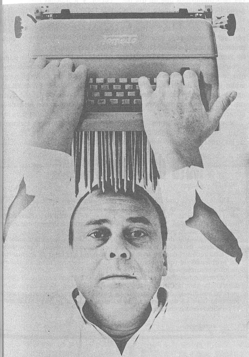
"El secretario del ministro Solchaga tecleándose las normas dictadas sobre la reconversión Industrial".

Como sobre este tema se han venido manejando cifras, conceptos, y filosofías para todos los gustos, con el único fin de intoxicar a la opinión pública, para en definitiva ser falsos, CNT cree que ha transcurrido el tiempo suficiente como para tener una perspectiva lo suficientemente buena para analizar el tema con realismo y amplitud, y no caer en el viejo tópico de "las ramas no nos dejan ver el bosque", trampa en la que CNT no ha caído ni antes ni ahora.