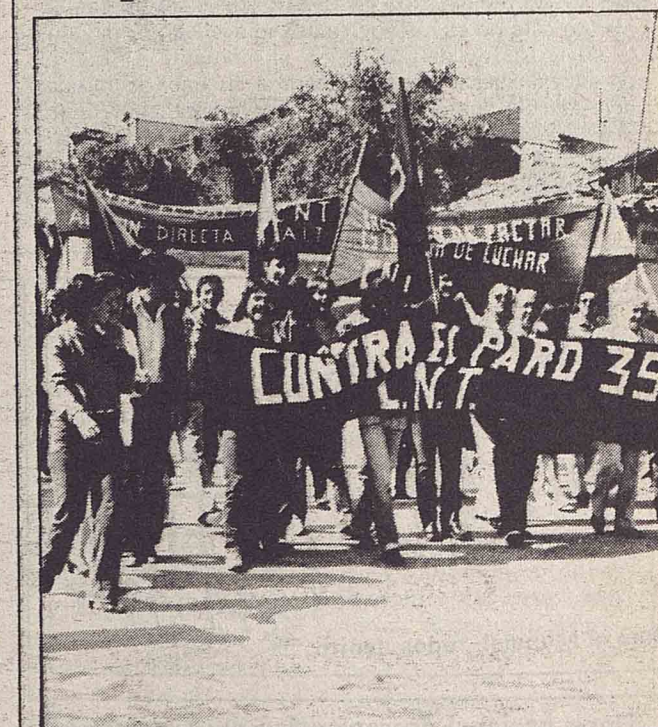
Los parados de Aranjuez ya saben cómo solucionar sus problemas.

La comisión de parados de Aranjuez, entre diversas acciones de lucha contra el problema del paro, han ocupado la finca «Sotomayor», perteneciente al Patrimonio Nacional, para crear una cooperativa de obreros agrícolas. Propuesta asumida en todo momento por la F. L. de Aranjuez de la CNT.