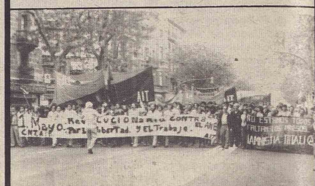
Manifestación de Barcelona.