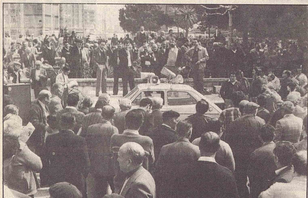
Asamblea informativa convocada por la Asociación de San Hildefonso de Cornellá. Tuvo lugar el día 3 de las corrientes una asamblea informativa convocada por la Asociación de Vecinos de San Hildefonso de Cornellá, para informar de los profundos problemas que los vecinos de esta localidad tienen planteados contra el Ayuntamiento. El acto se celebró a plena luz del día, en la calle, lo que encontramos muy pausable, deseando que cunda el ejemplo.