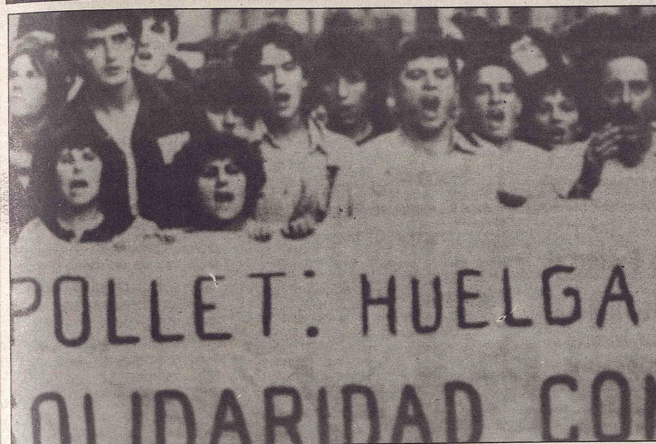
La manifestación congregó a unas 8.000 personas, que gritaron contra CC OO, UGT, PCE y PSOE. Los mayoritarios negaron su apoyo a los trabajadores despedidos.

IV época. Número 59. Madrid, junio 1982. 30 pesetas.