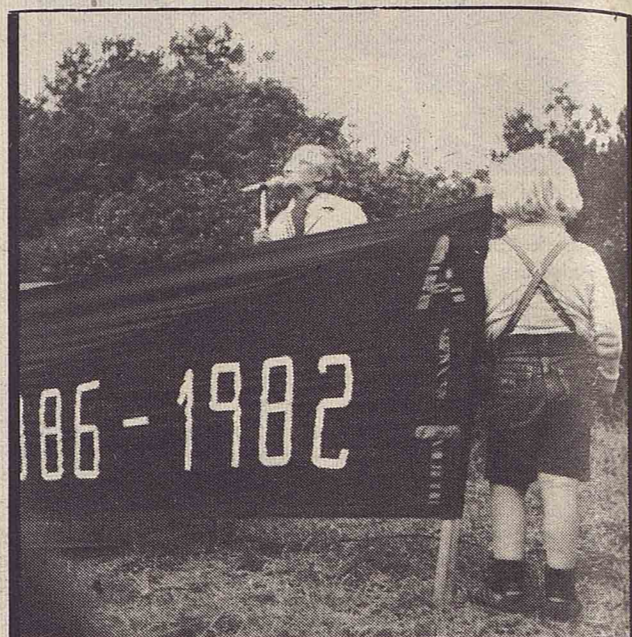
Federica Montseny, en Candás.

Hemos recibido cantidad de información gráfica, al cierre de esta edición, dedicamos estas líneas para reproducir algunas de ellas.