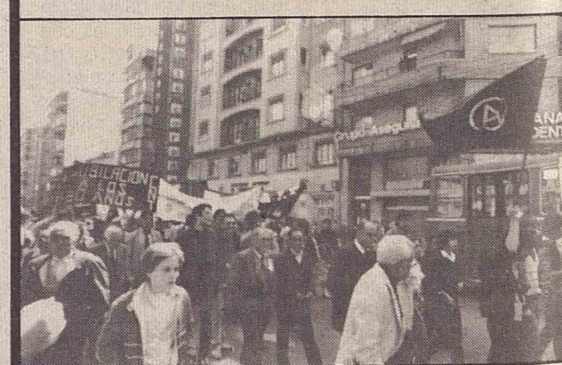
Manifestación en Zaragoza.