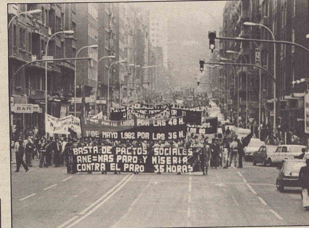
BILBAO 1.º DE MAYO. Como en toda España, la CNT pisa la calle con paso firme.

ESPECIAL ANDALUCIA: LAS ELECCIONES AL PARLAMENTO ANDALUZ