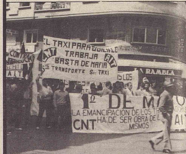
Manifestación en Málaga.