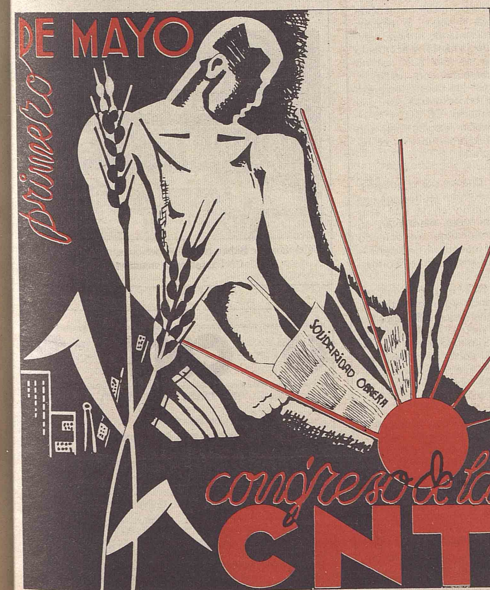
El 1.º de Mayo, con decisión al VI Congreso.