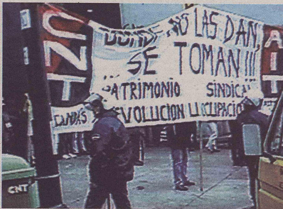
Concentración de la CNT ante el edificio del CES.

Las informaciones aparecidas en la prensa del momento se hicieron únicamente eco de lo que dijeron los portavoces oficiales y los dirigentes de UGT y Comisiones Obreras, Cándido Méndez y Antonio Gutiérrez, que magnificaron de manera exagerada los daños ocasionados por la actuación policial, asignándoselos a la CNT. Sus descalificaciones