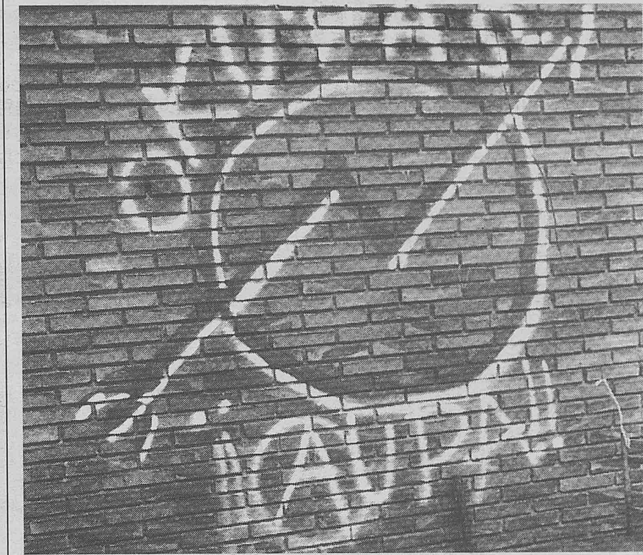
RED DE LAVAPIÉS

colectivo. En este sentido, estamos iniciando ya proyectos como los de hacer mercados de intercambio de objetos y como los bancos de tiempo.