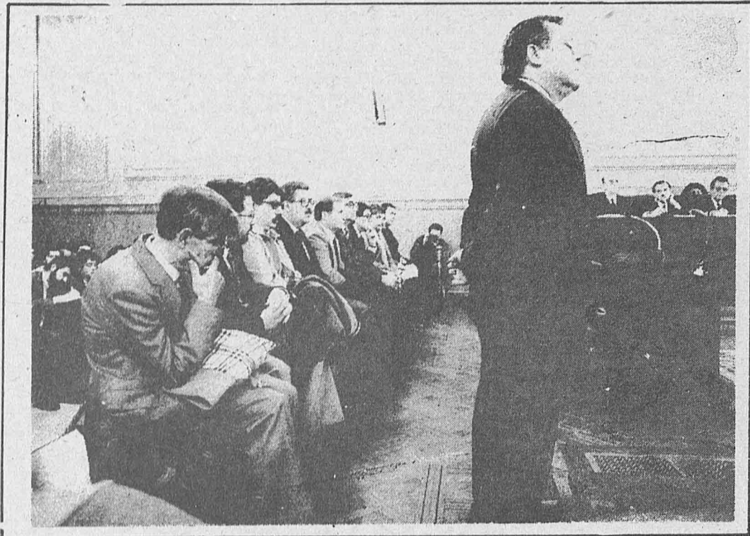
De pie el Director de la cárcel de Carabanchel. Sentados funcionarios y médicos que le torturaron hasta la muerte.