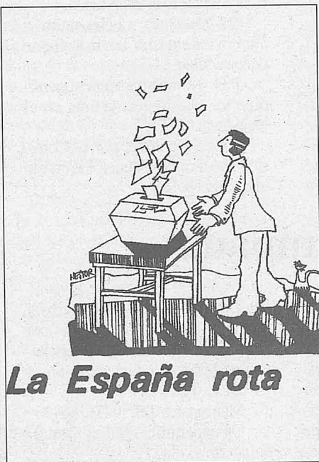
La España rota

Nosotros creemos, en cambio, que sí tendría enjundia valorar el hecho psicológico, y las variables sociológicas que en él concurren, por el que una masa considerable del electorado toma precipitadamente y a muy última hora una decisión que parcialmente contradice el sentido de las encuestas. ¿Acaso